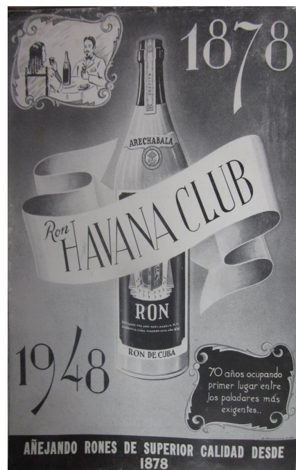
Fig. 3. Publicidad del ron Havana Club, Revista Gorgejuela. Año 1948

El "Havana Club" se venía fecundando desde la fundación de la Vizcaya en 1878, pero por razones desconocidas, no existen registros de su producción en los informes de producción de licores cubanos, según los archivos del Fondo de Marcas y Patentes del A.H.N. Este sería el ron que años más tarde distinguiría a Cuba ante el mundo. El nuevo producto se comercializó con una novedosa imagen, Arechabala, seleccionó para su logotipo la figura de la Giraldilla, en representación de la Habana, donde se encontraban los clubes más famosos de Cuba.