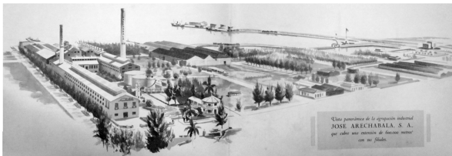
Fig.1. Vista sureste-noroeste del conjunto a industrial y la bahía. 1953.

A Cárdenas la caracteriza su patrimonio industrial, en particular por tener el “hado” de ser el origen y centro de una de las industrias que enorgulleció a Cuba ante el mundo: José Arechabala S.A., objeto de interés de esta investigación, uno de los máximos exponentes de la huella del azúcar y el ron en la cultura y la economía cubana; siendo cuna del prestigioso Ron “Havana Club” lo que le otorga a esta ciudad una significativa impronta.