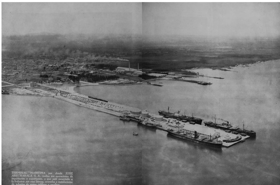
Fig.2. Vista aérea de la bahía de Cárdenas, en primer plano el espigón con los barcos, segundo plano la zona urbanizada por Arechabala y sus industrias.